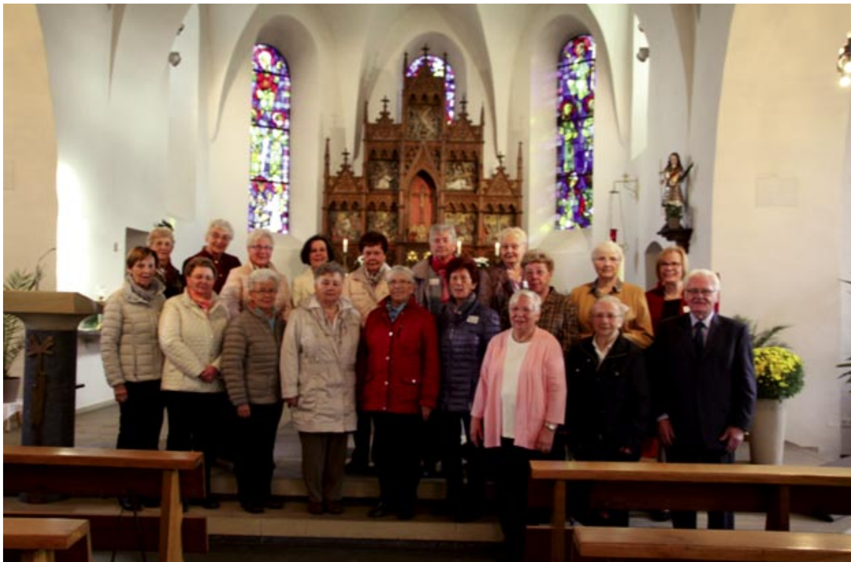
Das Bild zeigt den Frauenchor Stockum zum 40-jährigen Bestehen am 15.10.2016

Der 1. öffentliche Auftritt war am 13. Mai 1977 zum 100-jährigen Jubiläum des MGV Stockum. Das war schon eine aufregende Sache. Aber es machte Spaß, Herzklopfen und Nervosität zu meistern und einen gelungenen Auftritt abzuliefern. Besuche von Sängerfesten, Gesang zu Jubiläen und in der Kirche gehörten