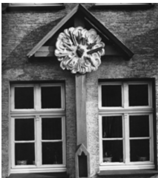
Die Fassade des Hauses in Sundern im Wandel der Zeit . . .