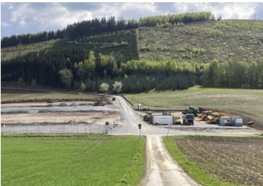
Auf der Holter Höhe werden Schotter und Kabelrollen von den unzähligen schweren LKWs angeliefert, damit die „Autobahn“ auf die Berghöhen für den Windpark gebaut werden kann!

Wer sich dazu näher informieren möchte, kann die Pläne im Sunderner Rathaus zu den Öffnungszeiten nach vorheriger Terminabsprache unter 02933 – 81237