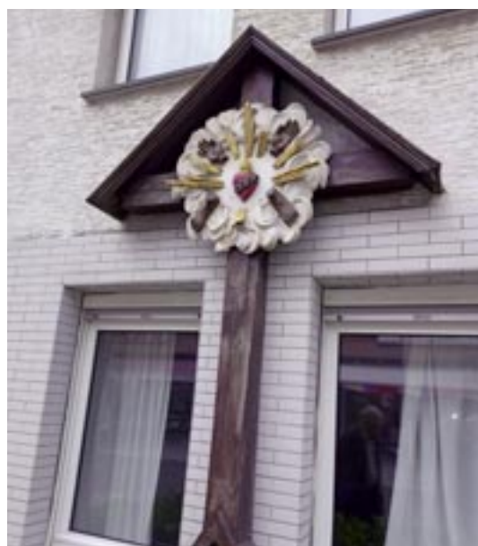
. . . das Kreuz bleibt

Ferdinand Tillmann Stiftung gehörenden, „Schepes Huaf“ in Dörnholthausen aufgestellt werden.